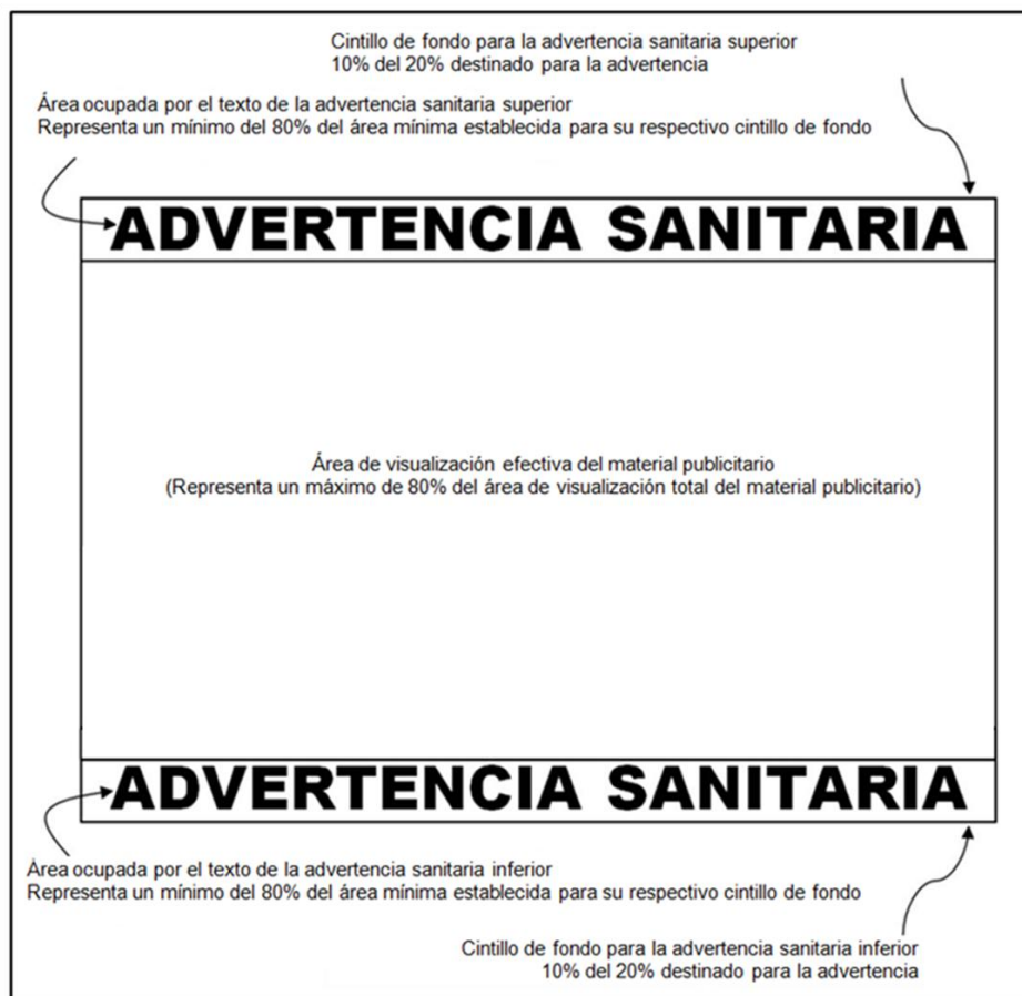
Figura 1. Normas sanitarias para materiales estáticos.

La figura 1 ilustra lo requerido por esta norma sanitaria: