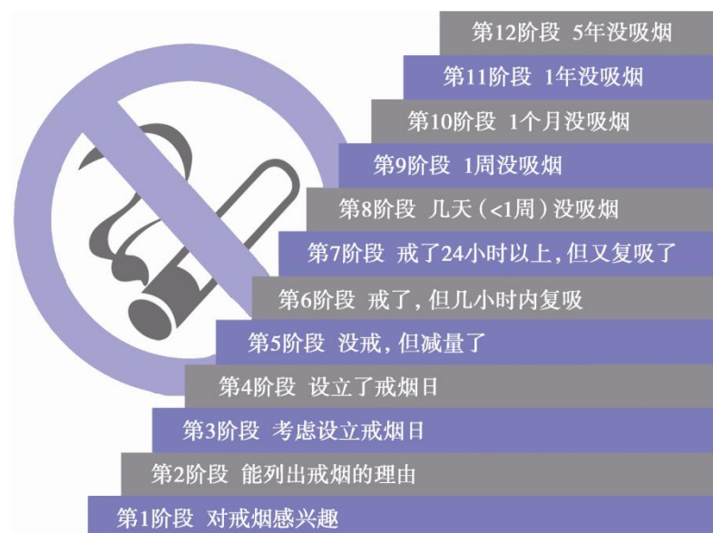
图2 成功戒烟的12个阶段

戒烟一般要经历从“没有想过戒烟”到“完全戒烟”的过程。因此，对于戒烟干预的结果，不应简单地理解为“戒”或“没戒”，而是递增的、阶段性的“成功”过程（图2）。多数吸烟者会经历全部或大部分戒烟阶段，最后才完全成功戒烟。临床医生要帮助每个吸烟者解决戒烟各阶段遇到的问题，最终成功戒烟。