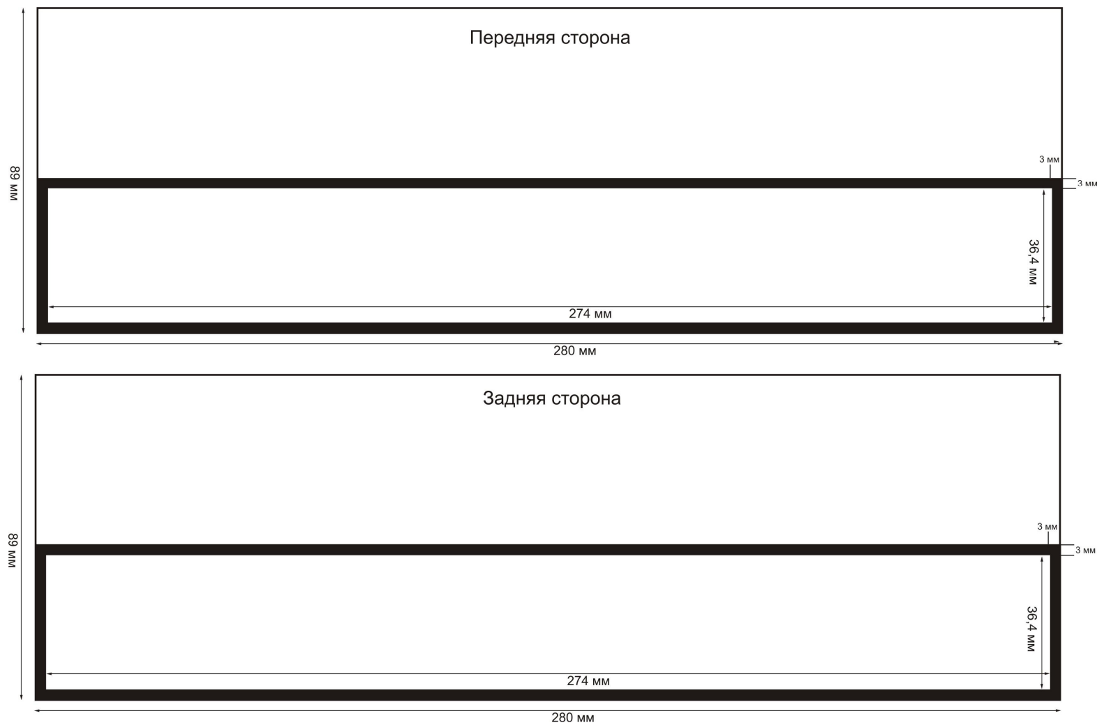
Схема 2. Расположение медицинского предупреждения на упаковке сигарет с фильтром типа Marlboro, L&M, Winston