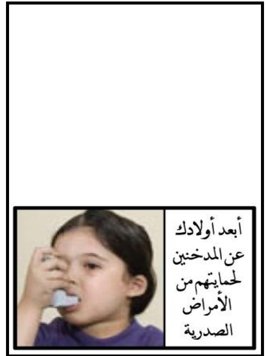
الشكل ٢ - الصور التحذيرية